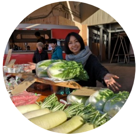
fresh vegetable & OYATSU 寿