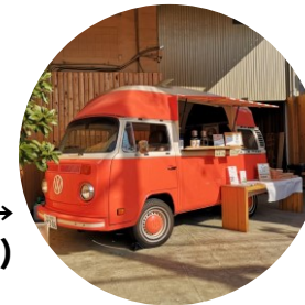
ドリンク → (ASA-FUKU CAFE)