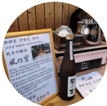
販売品を中心に炭火で焼いて提供します。 久栄丸(管志島)の海産物も♪