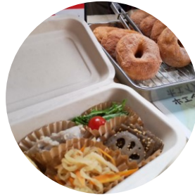
お惣菜&ドーナツ& ぜんざい(おんりい福)