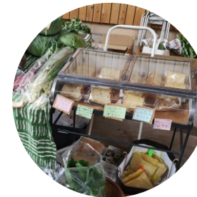
← 焼き菓子 (fresh vegetable & OYATSU 寿)