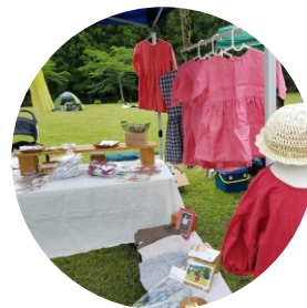
あいのて (1点もの洋服等のお仕立て)