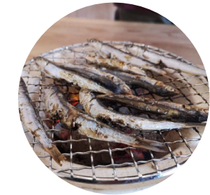
販売品を炭火で 焼いて提供します