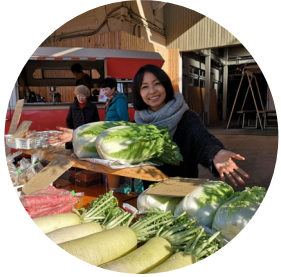
fresh vegetable & OYATSU 寿