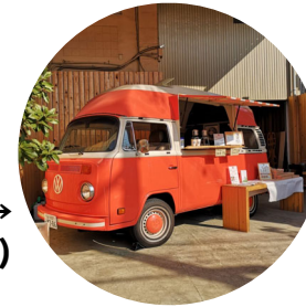
ドリンク → (ASA-FUKU CAFÉ)