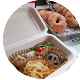
お惣菜&ドーナツ& ぜんざい(おんりい福)