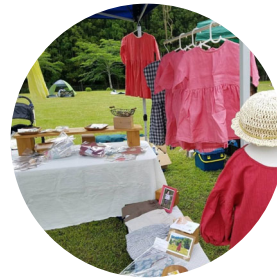
あいにて (1点ものの洋服等のお仕立て)