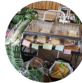
← 焼き菓子 (fresh vegetable & OYATSU 寿)